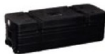
Valise de transport

Format image : 21/9 16/9 4/3 Dimensions : (l x h) 4,10 m x 3,20 m Toile : Vinyle tendu Section tube : 25 mm